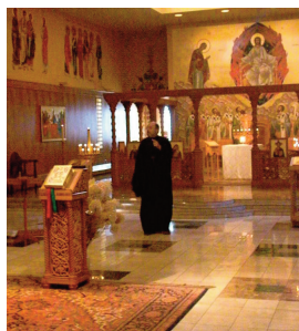
У Новом скиту иконостас не постоји