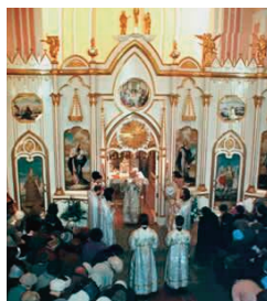
Руска архијерејска литургија