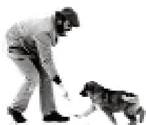
Монаси Новог скита гаје кучиће