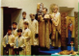
Мали Вход унијатске Литургије