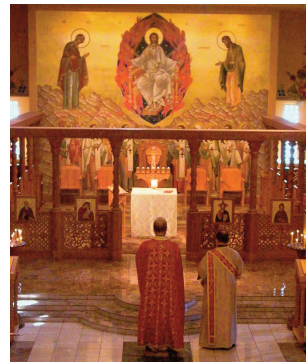
Литургија у Новом скиту отворени олтар