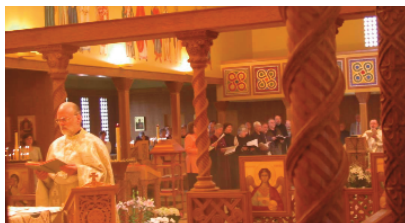
Литургија у Новом скиту: отворени олтар