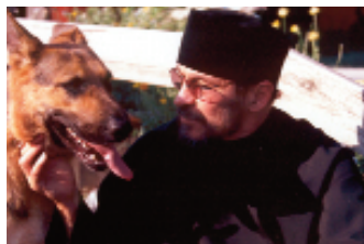
Нови скит и псопоклонство