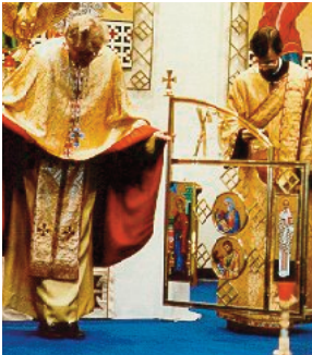
Унијатска Литургија: „провидни иконостас“