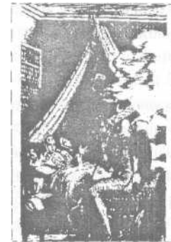
ЈУНГ ТОКОМ НОЋНИХ РАЗГОВОРА СА ФИЛЕМОНОМ